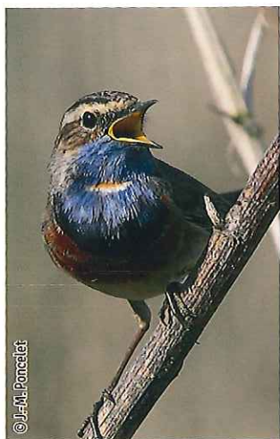
Gorgebleue à miroir

Une espèce Natura 2000 est une espèce en danger d'extinction, vulnérable, rare ou dont la répartition géographique est restreinte à l'échelle européenne. La liste des principales espèces Natura 2000 présentes dans ce site sont: