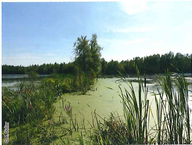
Végétation des plans d'eau riche en éléments nutritifs

Un habitat Natura 2000 est un milieu rare, menacé ou remarquable à l'échelle européenne. En Wallonie, ces habitats sont regroupés en unités de gestion (UG) nécessitant des mesures 1 pour les maintenir dans un état de conservation favorable. La liste des principaux habitats Natura 2000 présents dans ce site sont: